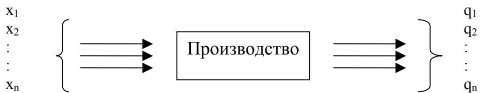
Рис. 1.1. Модель производственного процесса в виде черного ящика